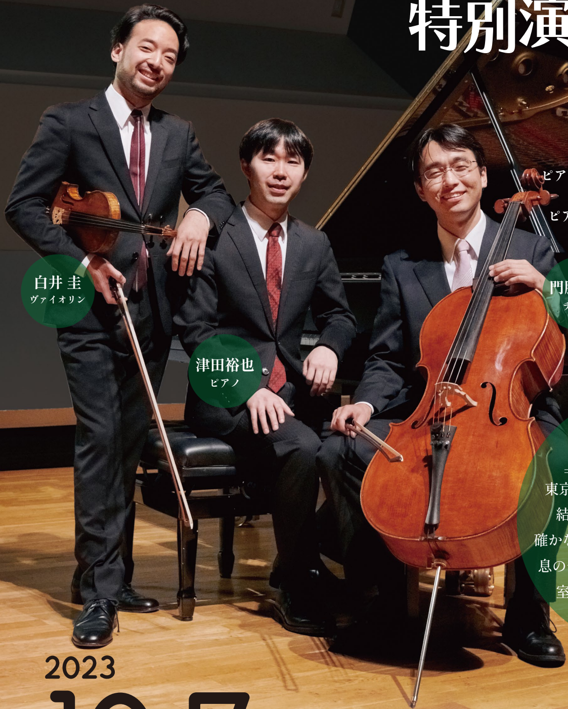
白井 圭 ヴァイオリン